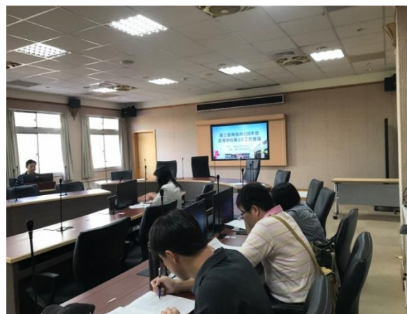
科主任討論修改草案內容