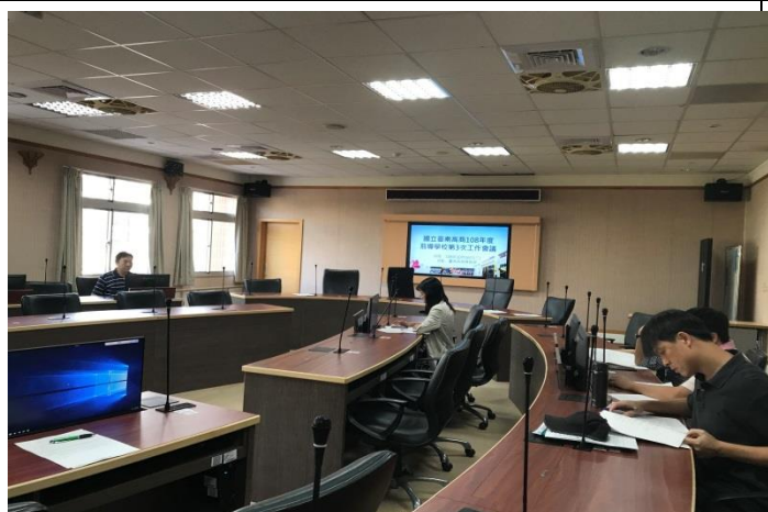
科主任討論修改草案內容