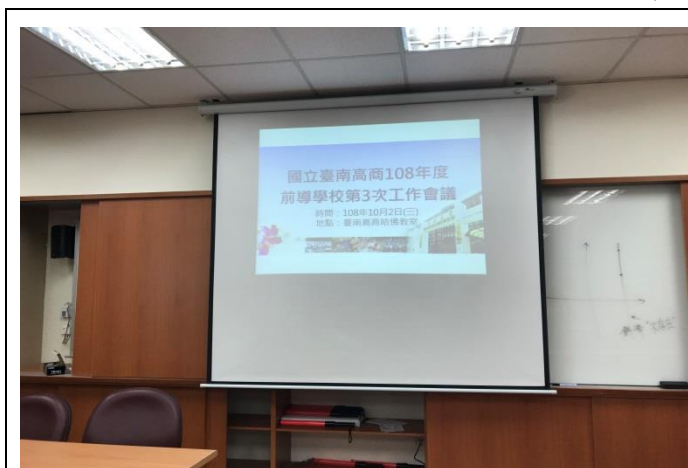
前導學校第三次工作會議