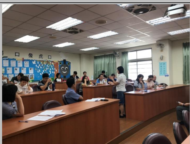
貴芬組長說明本校評鑑草案