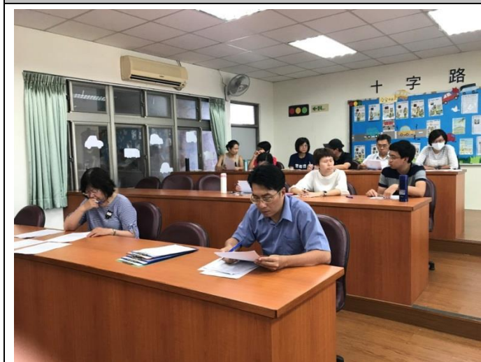
工作小組提出意見