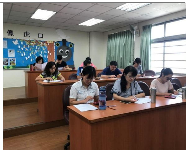
工作小組參閱會議資料