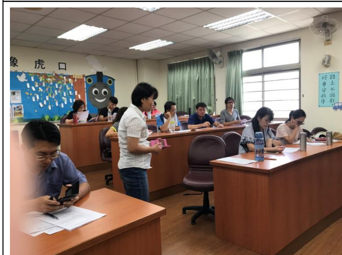
貴芬組長說明教師學習社群成員