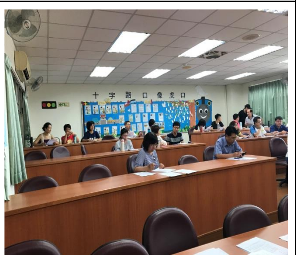
工作小組參閱會議資料