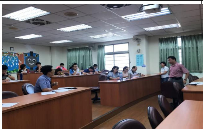
工作小組提出建議