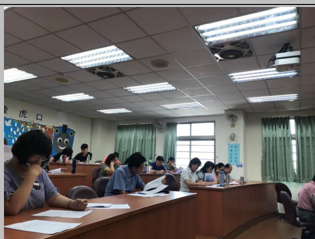
工作小組參閱會議資料