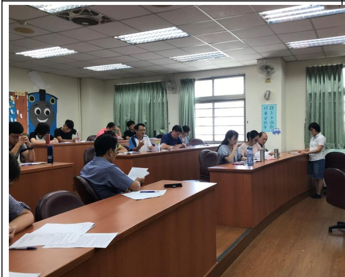
討論自主學習空間規範