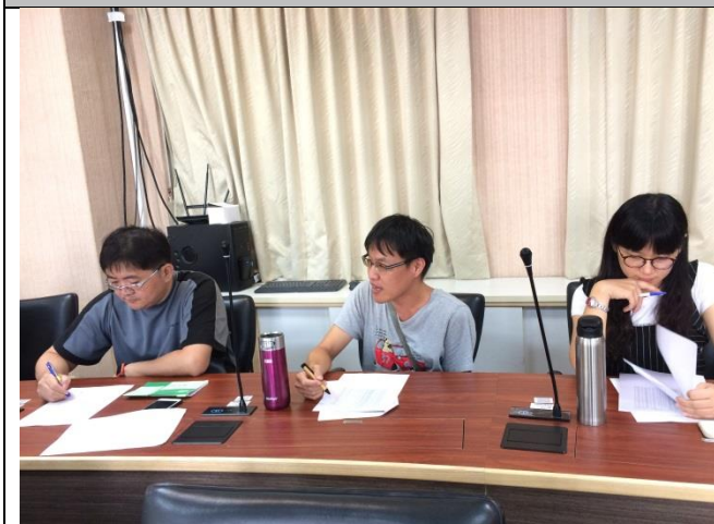
國榮老師補充說明