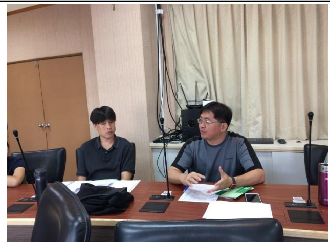
忠翰老師補充說明