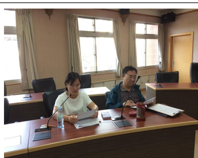
貴芬組長補充說明