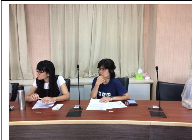
昭君老師補充說明