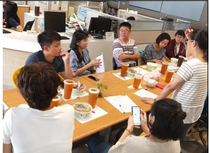
課程諮詢師討論執行方式