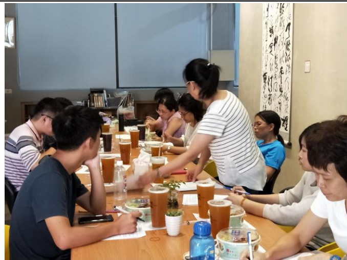
課程諮詢師討論任務分配