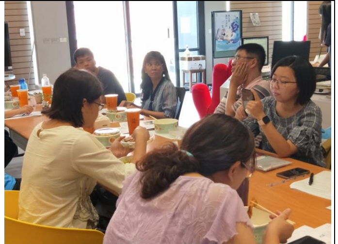
課程諮詢師討論執行方式