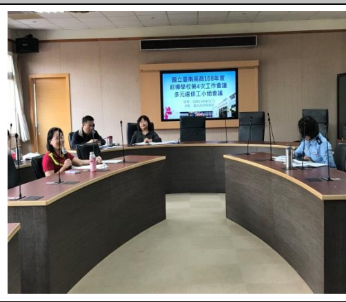
貴芬組長說明選修分組注意事項