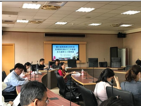
說明多元選修課程學生作品櫥窗預計時間