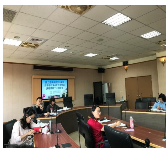
基宏主任補充說明