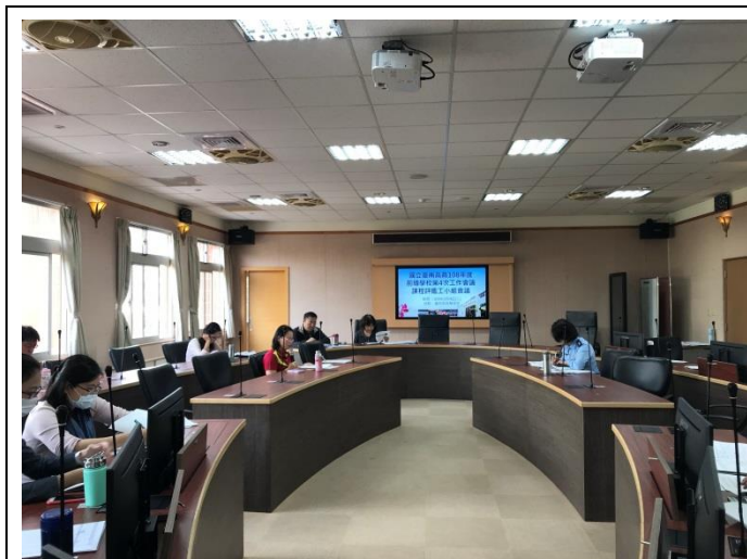
貴芬組長說明高一學習歷程各科進度