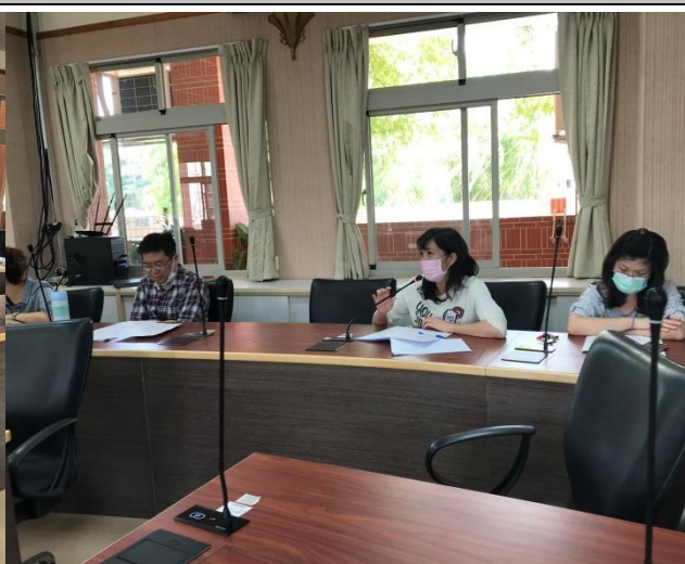
文淑菁老師對學生回饋單用語提出建議