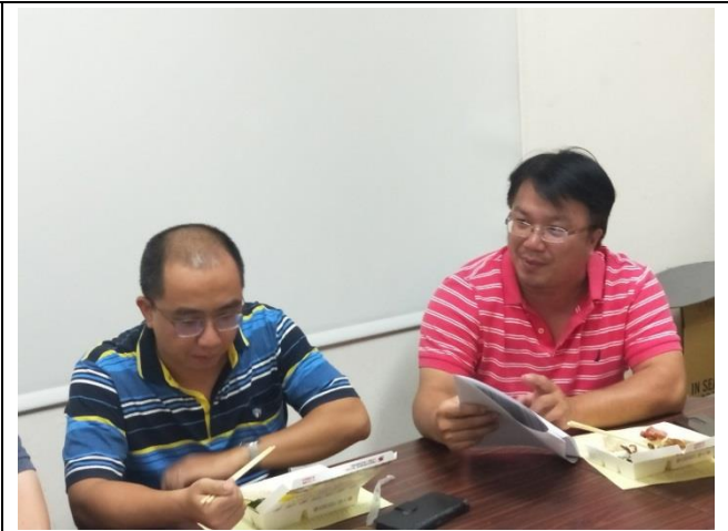
教師討論分組教學學生程度