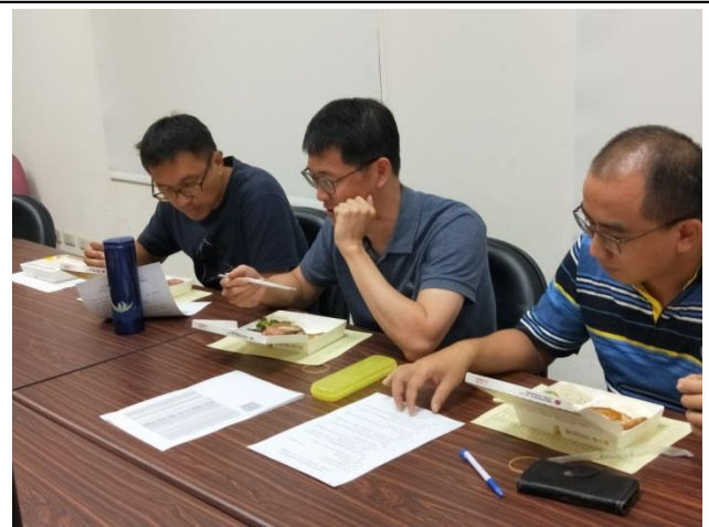
檢視分組後學生成績變化