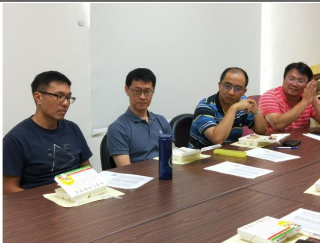
教師分享適性分組教學學生學習狀態