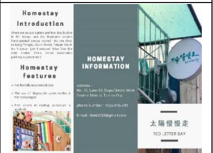
學生設計民宿介紹三折頁