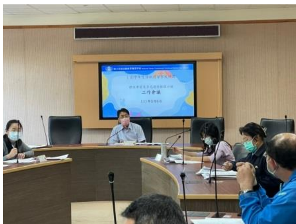
教師上學期授課歷程分享