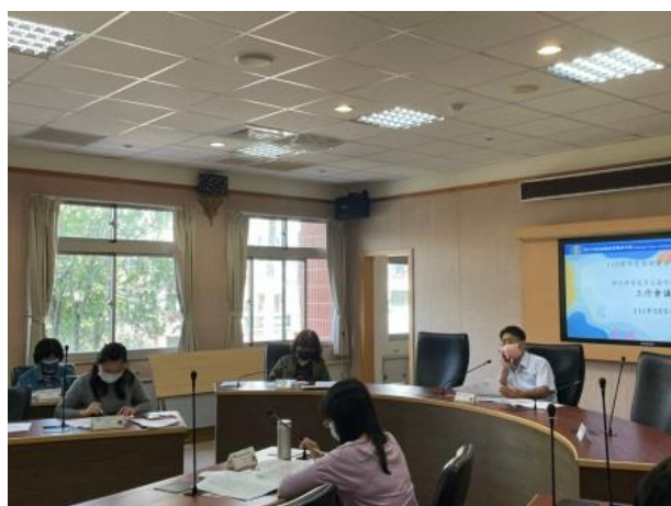
下學期課程進度討論