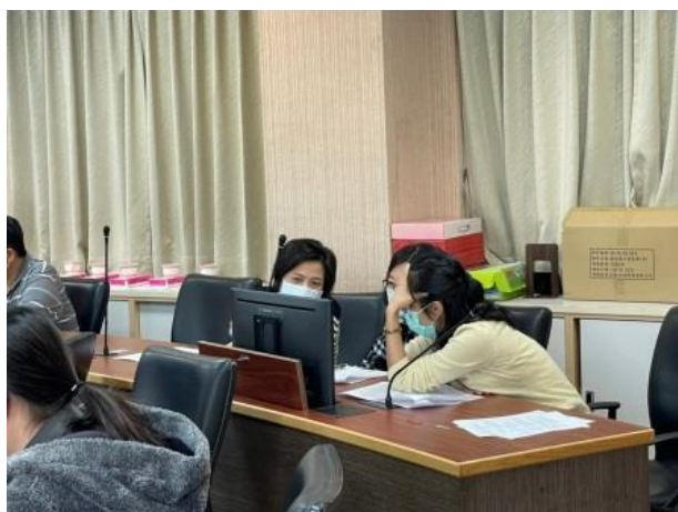
教師討論課程計畫