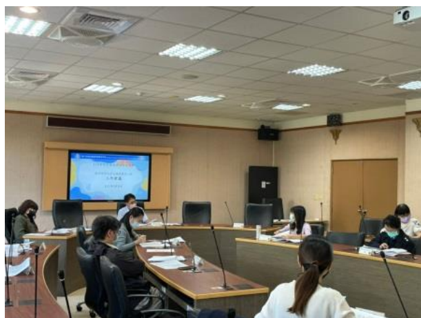
教師上學期授課歷程分享