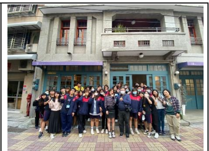
在地民宿導覽合照