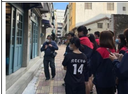
台南在地特色民宿踏查