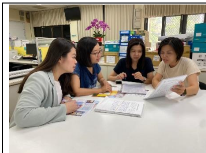
觀光科與應英科教師共備