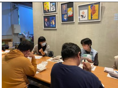
教師討論適性分組施行現況