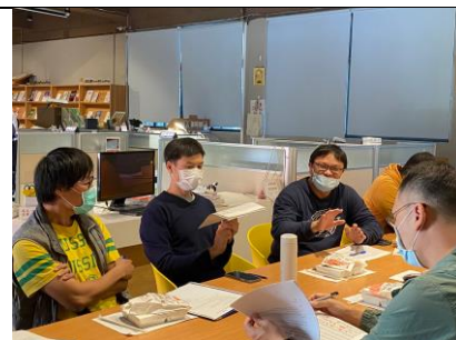
數學科召集人希望適性分組課程能施行高一至高三