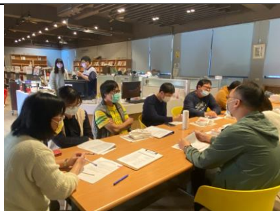
分析第一學期適性分組班平均與排名變化