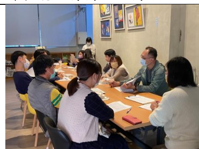
於下次會議研議是否調整高一新生適性分組抽離門檻