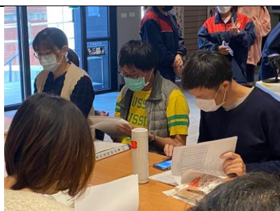
討論哈佛班學生的轉出異動與原班學生可否轉入哈佛班