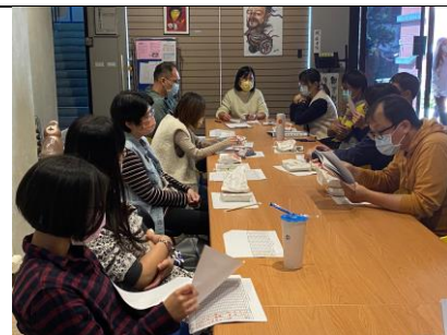
教師討論上學期授課情形