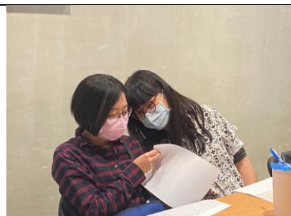
教師討論應數丙班成績與個別學生之學習狀況