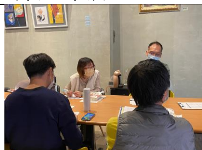
討論第二學期目前為止的授課情形