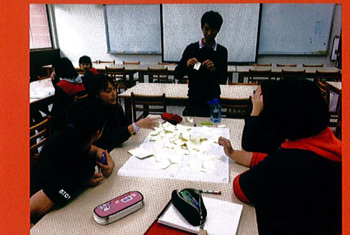
學生多元媒材研發社群研習-1