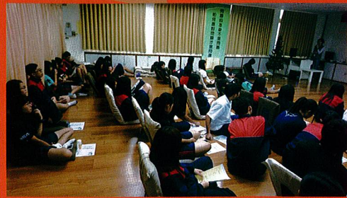
輔導股長幹部訓練