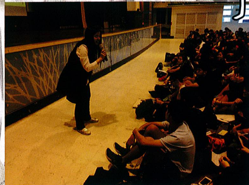
台灣壯遊感動分享講座