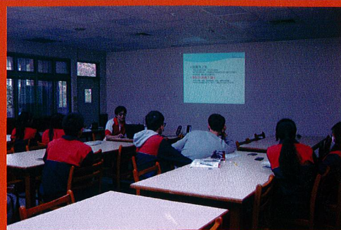
大學申請入學書審及面試指導說明會