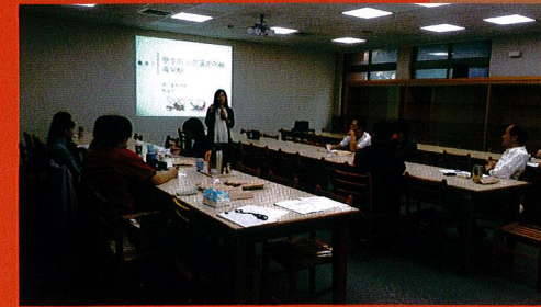
認輔教師輔導知能研習