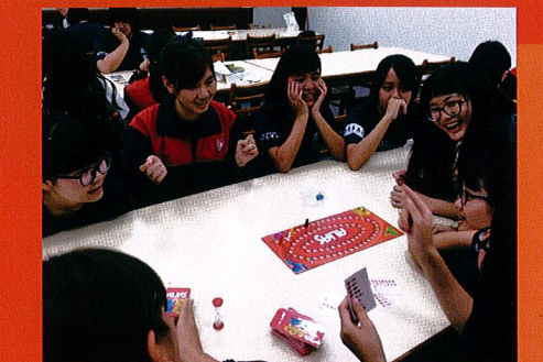
學生多元媒材研發社群研習-2