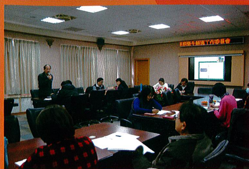
105-2學生輔導工作及家庭教育推動小組會議