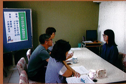
申請入學模擬面試