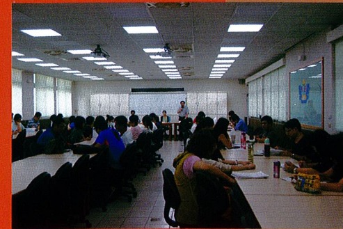
105升學輔導工作教師會議