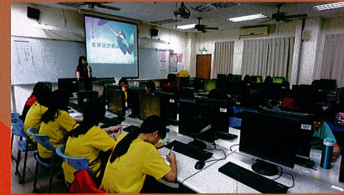
高三生涯信念檢核表施測與解釋