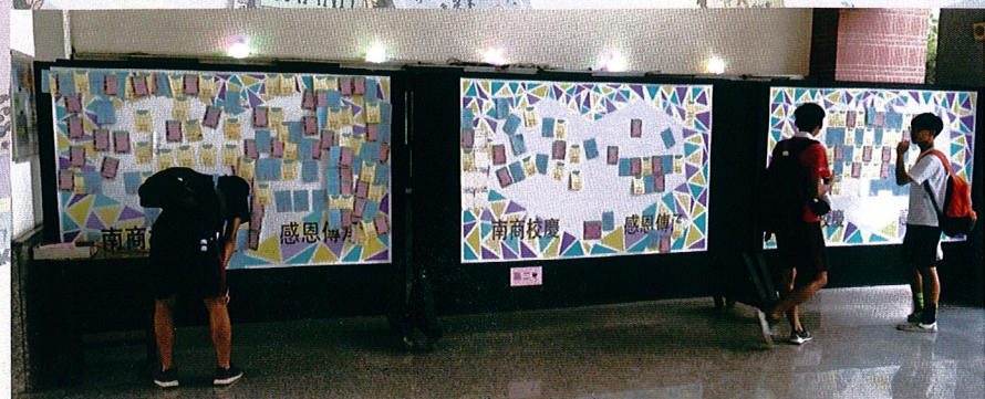
同學們於穿堂觀看感恩小卡