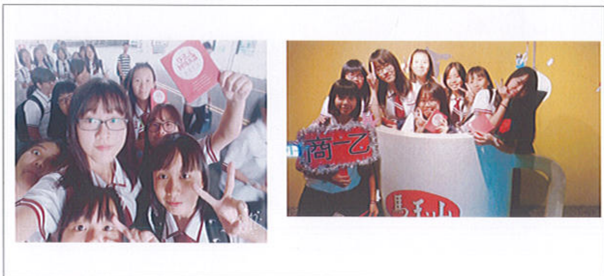
106 學年度校外職場體驗照片