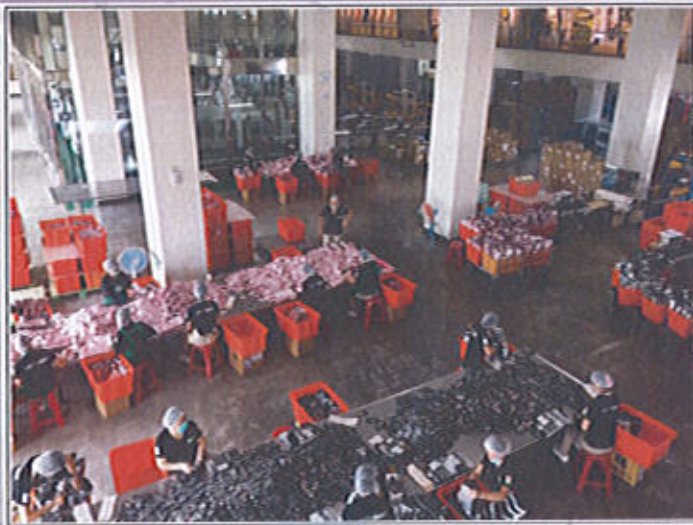
參訪公司當日員工工作情況，工作流程環環相扣