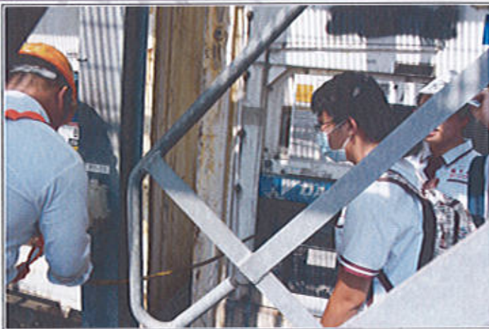
冷凍貨櫃使用體驗前解說