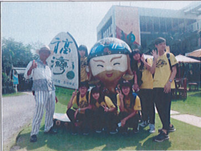
這次的參訪收穫良多，非常的開心