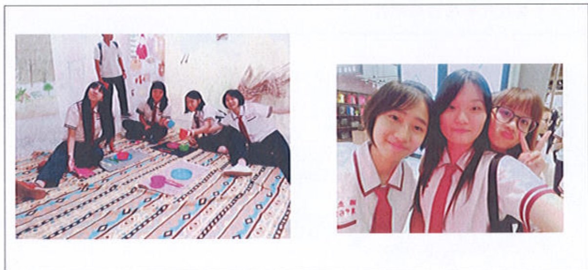
106 學年度校外職場體驗照片