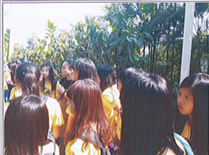
聽導覽員解說可可豆的製造過程