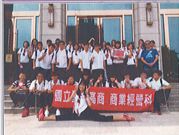
商一乙全體師生大合照，獲得寶貴的職場體驗