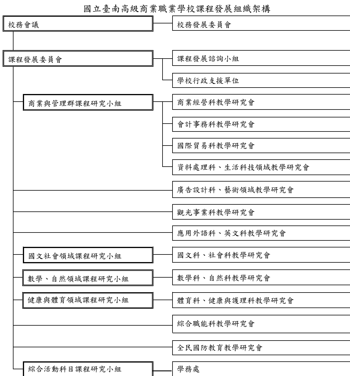
圖 1 國立台南高商課程發展組織架構圖