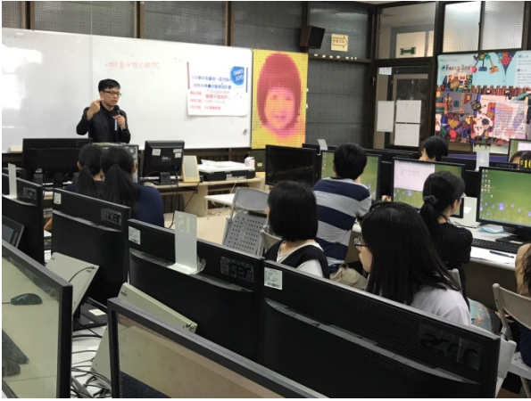
108年10月2日(三)下午14:00至17:00 Illustrator 簡報平面設計