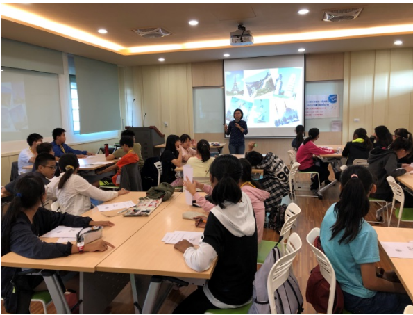
108年11月27日(三)下午13:00至16:00 應外科教學資源合作共享