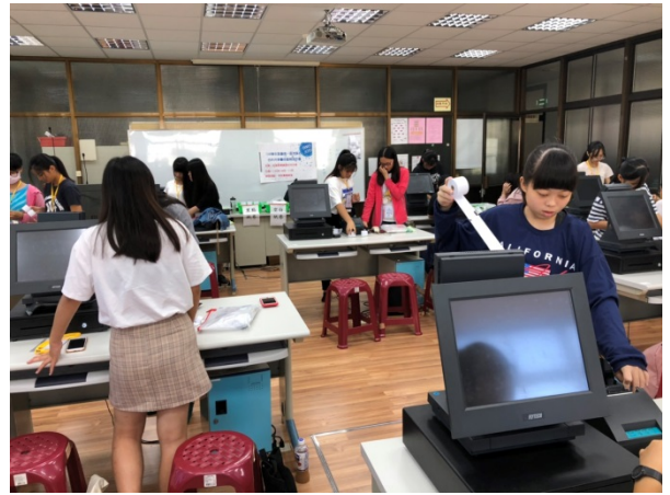
108年11月27日(三)下午13:00至16:00 商經科教學資源合作共享