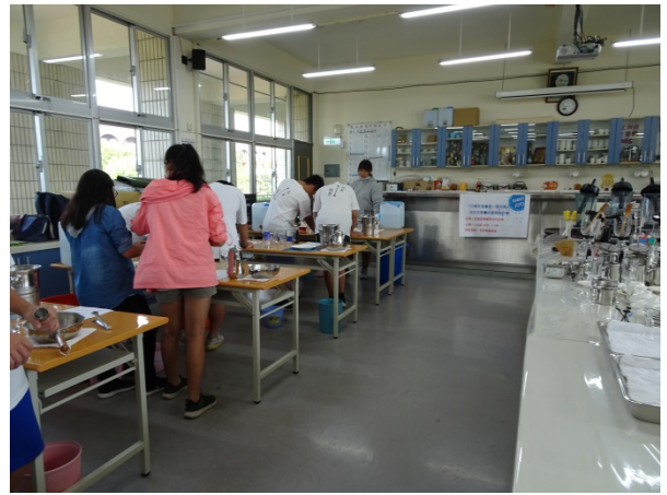
108年10月16日(三)下午13:00至16:00 觀光科教學資源合作共享