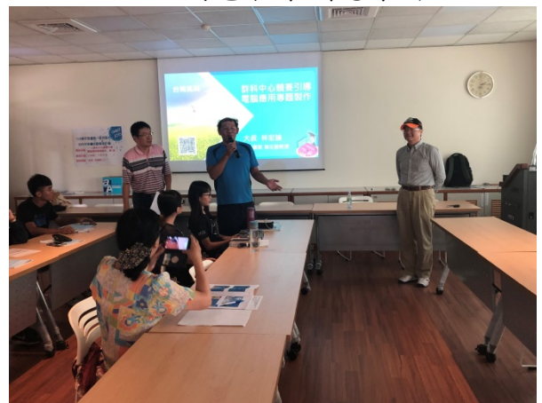
108年9月27日(五)下午14:00至17:00 以群科中心競賽引導電腦應用專題製作