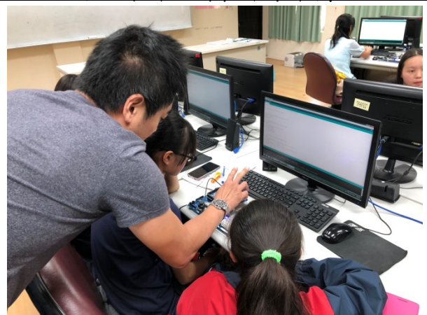
108年11月9、10日(星期六、日)上午08:00至17:00。Arduino的應用與實作