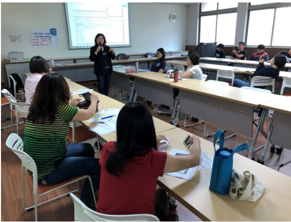
108年11月1日(五)下午14:00至17:00 運用行銷企劃製作專業簡報