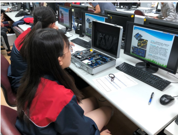
108年11月9、10日(星期六、日)上午08:00至17:00。Arduino的應用與實作