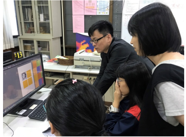
108年10月2日(三)下午14:00至17:00 Illustrator 簡報平面設計