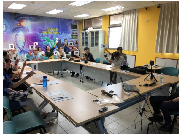
108年9月20日(五) 上午09:30至12:30 VAR 特色教學創意學習