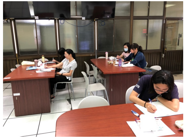
108年9月19日(四) 上午09:30至12:30 簡報設計原理與應用講座