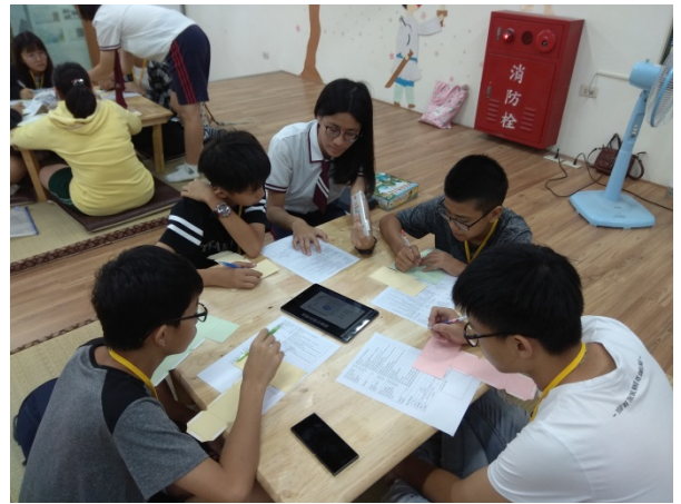
108年12月9日(一)下午13:00至16:00 國貿科教學資源合作共享