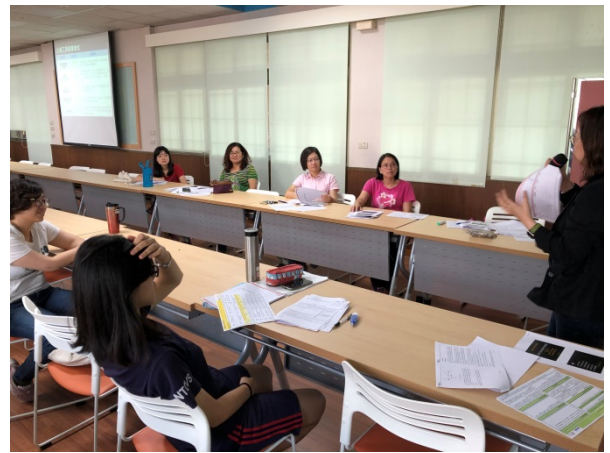
108年11月1日(五)下午14:00至17:00 運用行銷企劃製作專業簡報