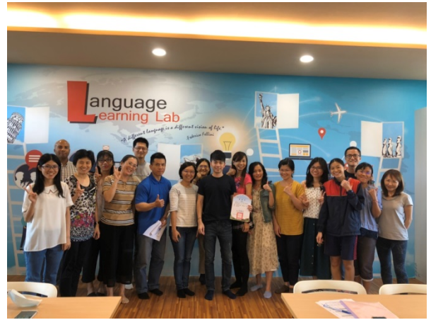
108年10月22日(二)下午13:00至16:00 語塊的教與學：Theory and Practice