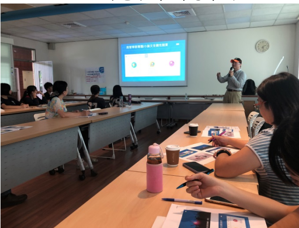
108年9月27日(五)下午14:00至17:00 以群科中心競賽引導電腦應用專題製作