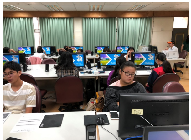
108年10月19日(六)上午8:00至17:00 Excel 統計分析及圖表運用於專題製作上