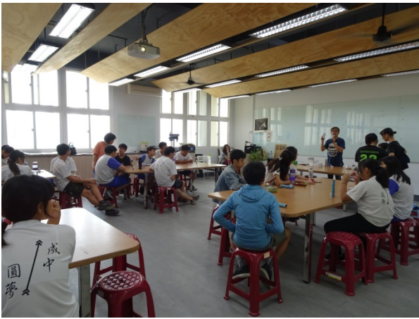
108年10月16日(三)下午13:00至16:00 廣設科教學資源合作共享