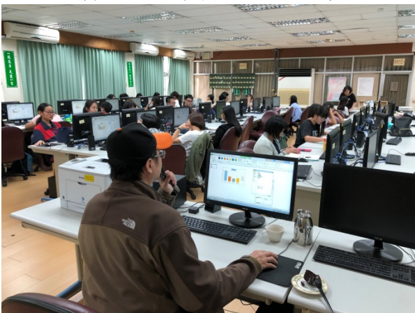
108年10月19日(六)上午8:00至17:00 Excel 統計分析及圖表運用於專題製作上