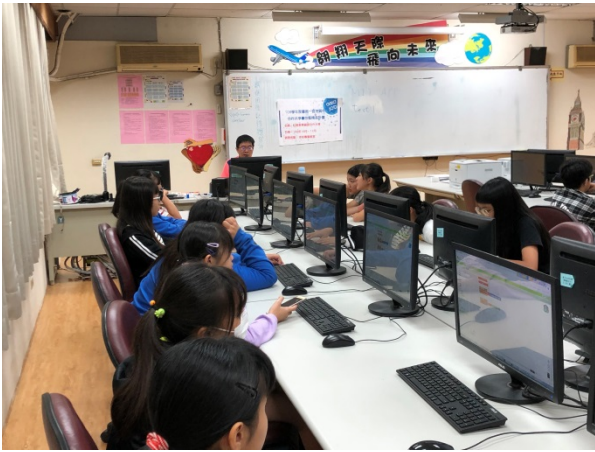
108年11月23日(六)上午09:00至12:00 資處科教學資源合作共享