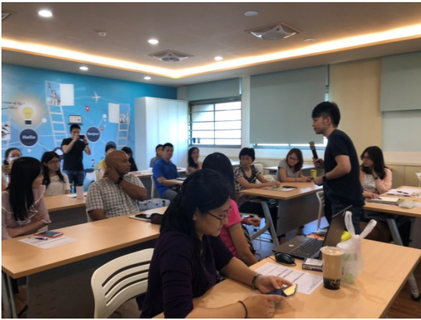
108年10月22日(二)下午13:00至16:00 語塊的教與學：Theory and Practice