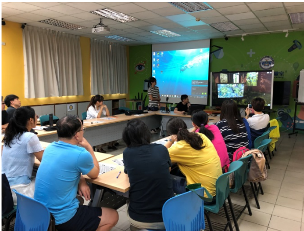
108年9月20日(五) 上午09:30至12:30 VAR 特色教學創意學習