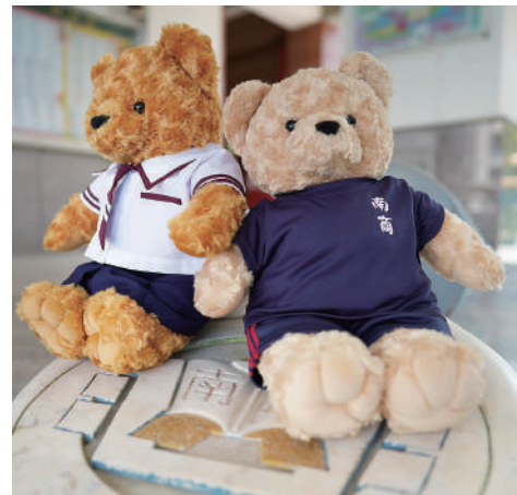
南商制服紀念小熊