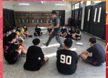
多元探索活動：體驗教育課程