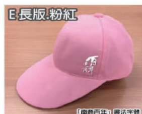
「南商百年」書法字體