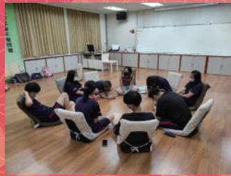
性別相處與溝通小團體