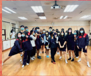
心衛講座-愛情告解室