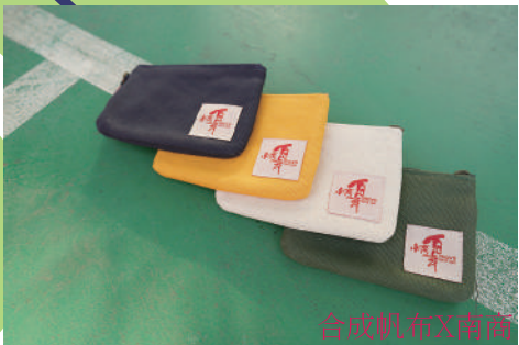
合成帆布X南商 紀念零錢包