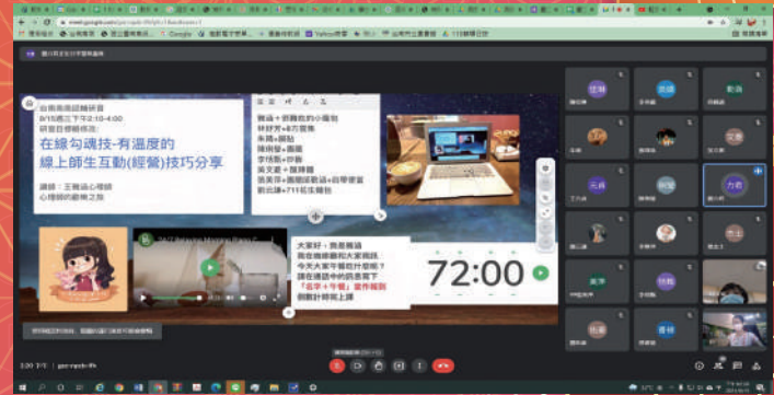
認輔教師與輔導知能線上研習