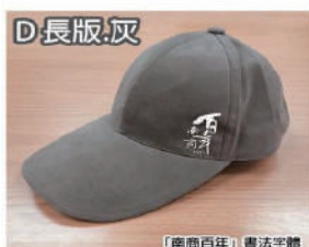
「南商百年」書法字體