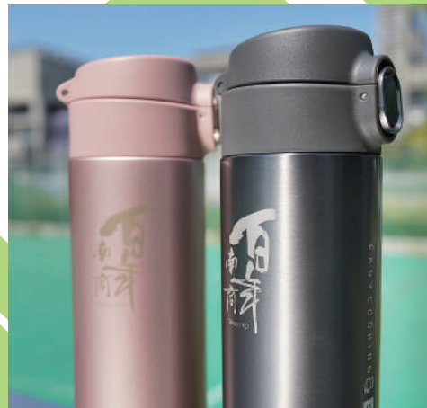
EASY COOKING X南商 百年紀念款保溫杯