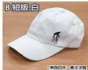
「南商百年」書法字體