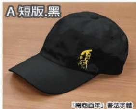
「南商百年」書法字體