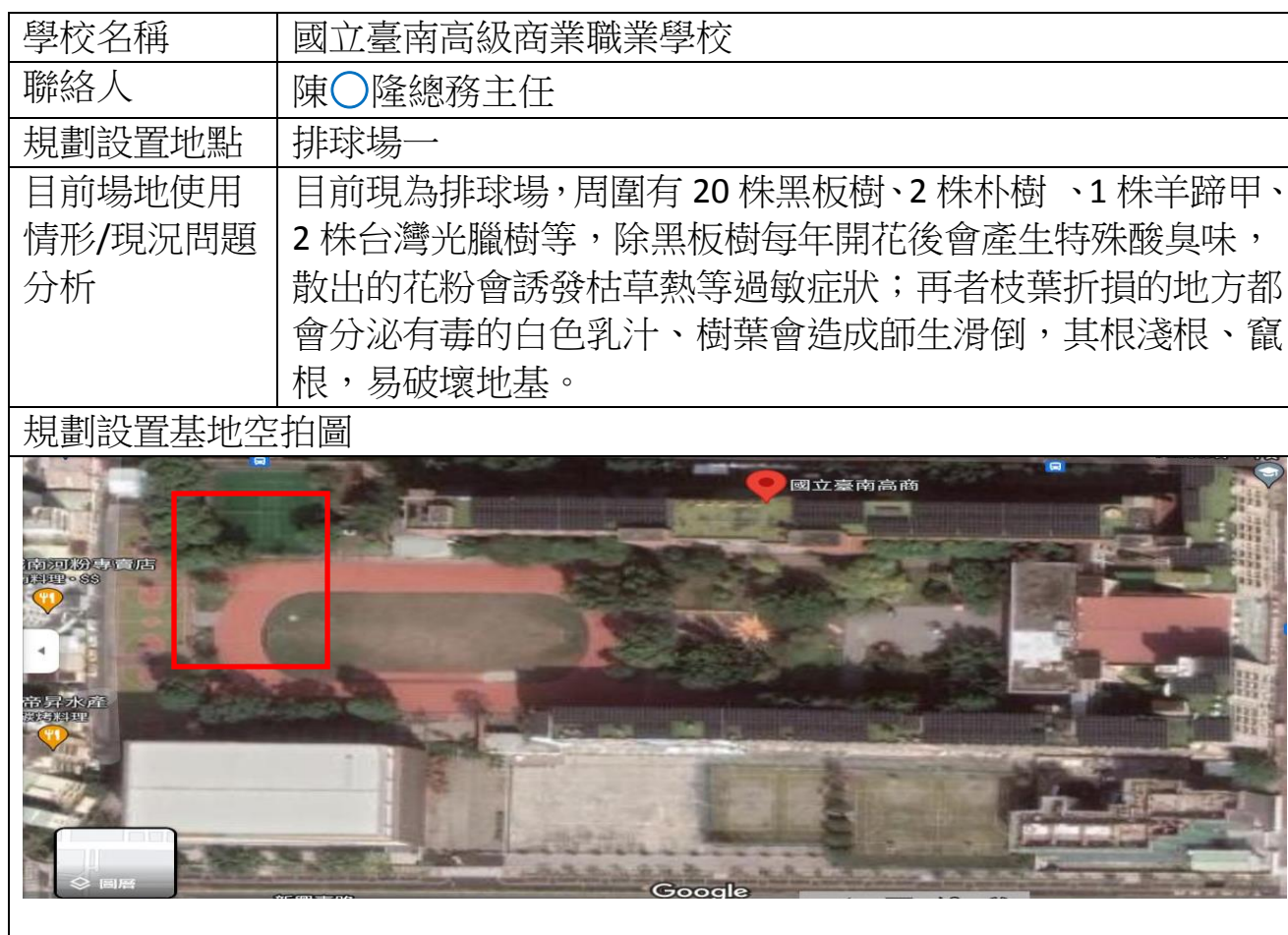
附表 2-1 運動場地設置規劃說明表

排球場三與籃球場，位於本校實習大樓新建處旁，南面臨新興東路；籃球場二邊接各有 6 株小葉欖仁，離設置太陽能光電基座僅 1 公尺內。