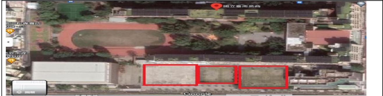
附表 2-2 校園景觀異動規劃差異對照圖(可以校園平面、空拍、廠商規劃圖呈現)