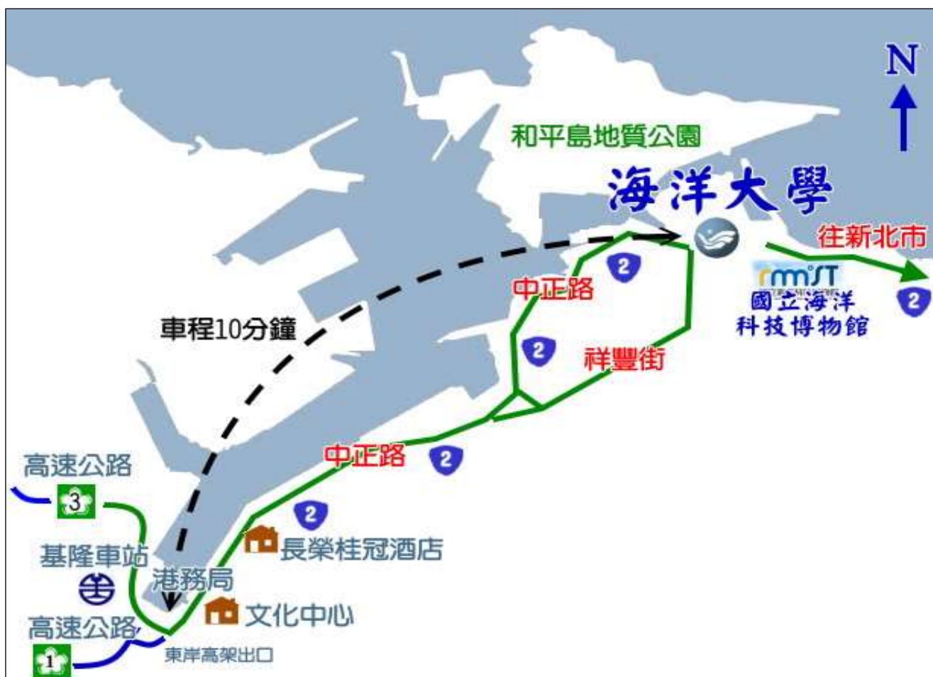
【國立臺灣海洋大學交通資訊】