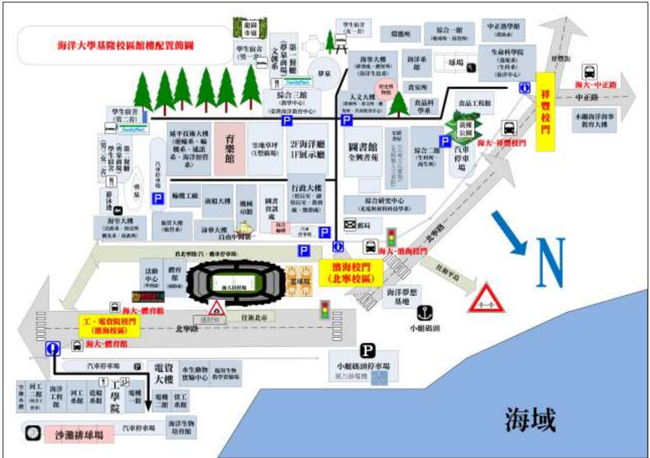
【國立臺灣海洋大學校區館樓配置圖】