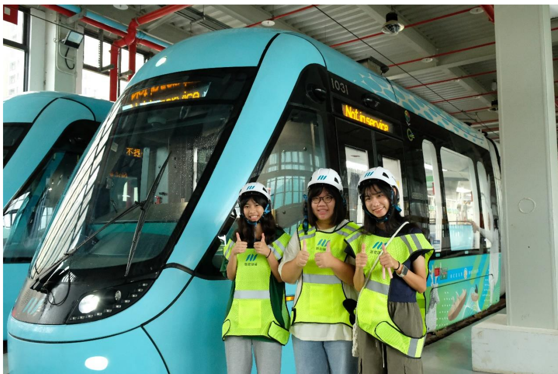
圖四 青年運輸營:淡海輕軌機廠工程參訪