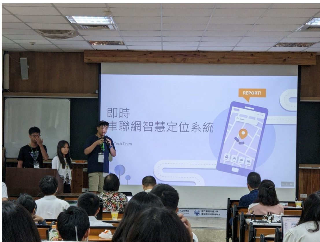
圖五 青年運輸營:決賽評審簡報