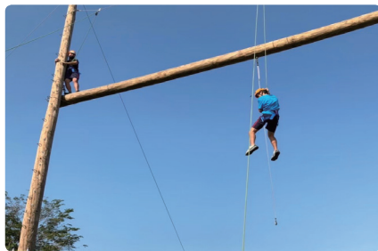
南商玩很大 - 探索教育活動