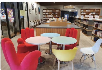
一樓閱讀休憩雅座

南商藝廊是南商重要的資產與場域，圖書館每年都有精采的藝文活動與展覽供師生觀賞與參與，這幾年與業師結合，舉辦肖像漫畫教學與展覽活動已成為本館年度特色亮點，同學在老師傾囊相授下，也漸漸打開了一扇美術的視窗。