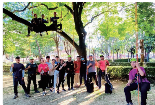
戶外教育攀樹體驗營

輔導處統籌了學生輔導工作委員會、家庭教育推動小組。而在工作項目上包羅萬象，包括有：個別輔導、諮商與諮詢、小團體輔導與諮商、個案會議、心理師諮商諮詢服務、生涯輔導、升學輔導、教師研習、家庭教育、性別平等教育、轉銜輔導及服務、認輔制度、心理測驗、輔導股長、輔導義工、多項國教署補助專案計畫經費申請；以及危機事件的處理與協助，優質化計畫各類師生活動。透過多元豐富的輔導活動規畫推動，並與教師、家長、行政人員等攜手合作，同時引入校外專業資源，共同維護學生福祉，陪伴學生度過最多變、又美好的青春年華。