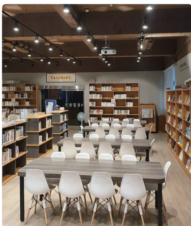
舒適的一樓閱讀講座區

圖書館除了豐富的藏書外，硬體設備與環境更是與時俱進。目前館藏共有紙本四萬五千餘冊、電子書千餘冊，固定期刊約三、四十種。