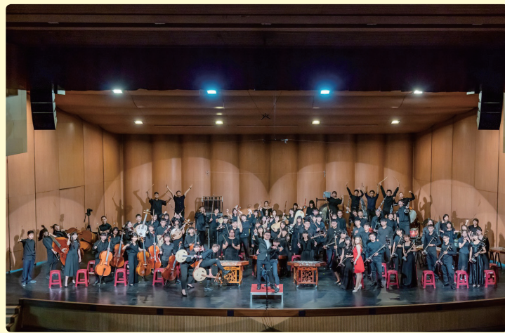
百年校慶國管樂隊聯合音樂會

營 造自主自律的人權校園，學生透過民主參與過程，普選成立班聯會、畢聯會等學生組織。本校學生社團多達五十個，涵括運動、音樂、藝術、語文各類，除辦理社團幹部研習，並輔導學生社團辦理各項動態靜態成果發表會，每學年校內外達數十場，提供學生多元展才場域。110年南商百年校慶暨運動大會，於生活美學館舉辦的「國管樂隊聯合音樂會」更獲各界好評。國樂團於106-112年間數度代表台南市進入全國賽，獲得特優、優等；管樂團於104-112年間管樂合奏多次獲得台南市優等，打擊樂合奏、銅管五重奏代表台南市進全國，獲得優等，表現亮眼；各社團表演亦讓人印象深刻。