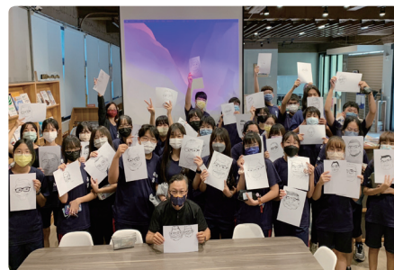
請業師前來舉辦小型研習