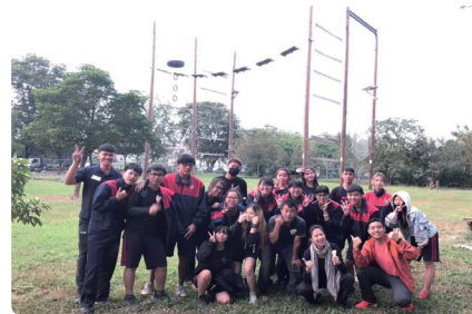
南商玩很大 - 探索教育活動