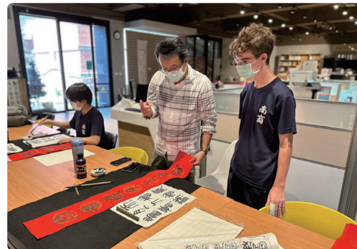
圖書館主任指導交換學生書法，與體驗春聯寫作。