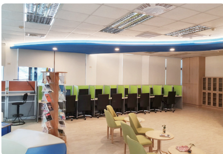
三樓影視聽學習區