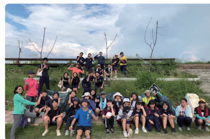
漁光島淨灘體驗活動