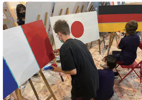
交換學生在廣設科的畫室裡，用壓克力顏料繪製各自國家的國旗。

南 商為國外學生來台進行文化交流與技能學習的首選學校之一。交換學生有各自所屬的班級以融入群體生活，並由校方安排課表，跨科進行各領域探索。他們擁有較多自主學習時間，在校方排定的中文課之餘，用以發掘自己的興趣與專長。交換學生亦參加社團活動，無論在校園各場合，他們都是相當受師生歡迎的風雲人物。