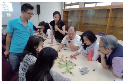
家庭教育工作坊 - 親子共遊研習