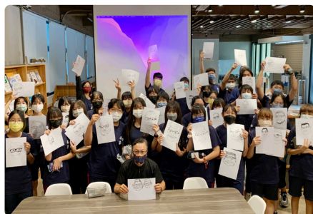
請業師前來舉辦小型研習