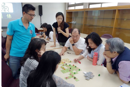
家庭教育工作坊 - 親子共遊研習