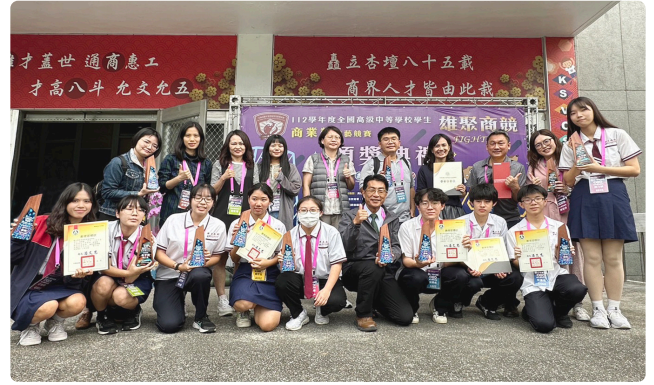
▲ 112 學年度南商選手榮獲兩座金手獎、六座優勝，成績全國第一