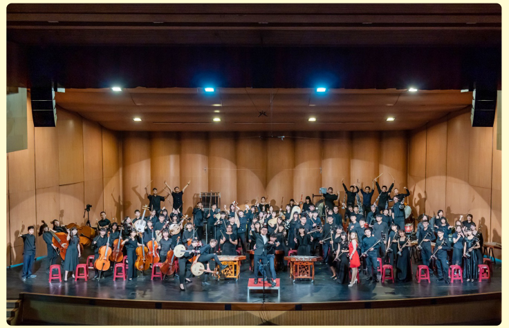
百年校慶國管樂隊聯合音樂會

營 造自主自律的人權校園，學生透過民主參與過程，普選成立班聯會、畢聯會等學生組織。本校學生社團多達五十個，涵括運動、音樂、藝術、語文各類，除辦理社團幹部研習，並輔導學生社團辦理各項動態成果發表會，每學年校內外達數十場，提供學生多元展才場域。110 年南商百年校慶暨運動大會，於生活美學館舉辦的「國管樂隊聯合音樂會」更獲各界好評。國樂團於 106-112 年間數度代表台南市進入全國賽，獲得特優、優等；管樂團於 104-112 年間管樂合奏多次獲得台南市優等，打擊樂合奏、銅管五重奏代表台南市進全國，獲得優等，表現亮眼；各社團表演亦讓人印象深刻。