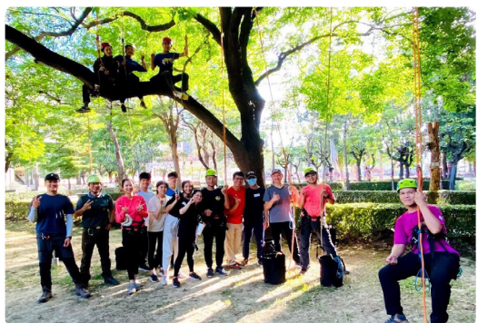
戶外教育攀樹體驗營