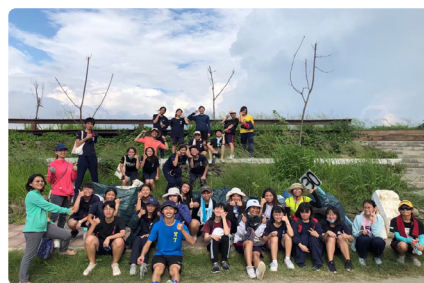
漁光島淨灘體驗活動