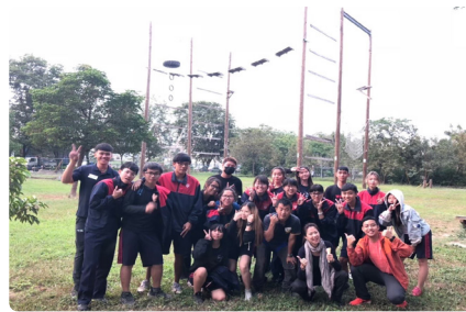
南商玩很大 - 探索教育活動