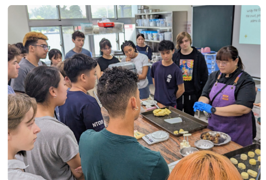
交換學生體驗觀光科專業課程，由教師帶領製作中式糕餅。