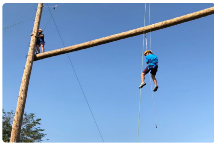
南商玩很大 - 探索教育活動

輔 導處統籌了學生輔導工作委員會、家庭教育推動小組。而在工作項目上包羅萬象，包括有：個別輔導、諮商與諮詢、小團體輔導與諮商、個案會議、心理師諮商諮詢服務、生涯輔導、升學輔導、教師研習、家庭教育、性別平等教育、轉銜輔導及服務、認輔制度、心理測驗、輔導股長、輔導義工、多項國教署補助專案計畫經費申請；以及危機事件的處理與協助，優質化計畫各類師生活動。透過多元豐富的輔導活動規畫推動，並與教師、家長、行政人員等攜手合作，同時引入校外專業資源，共同維護學生福祉，陪伴學生度過最多變、又美好的青春年華。