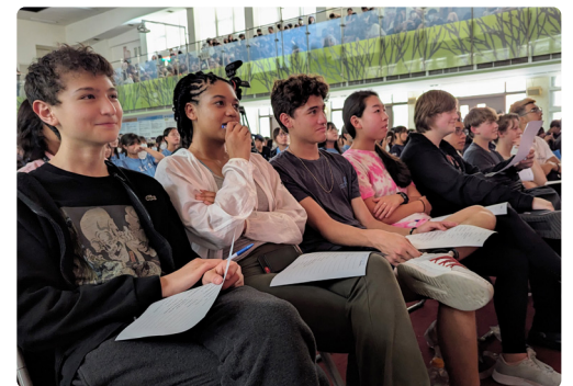
交換學生擔任英文歌唱比賽評審。

南 商為國外學生來台進行文化交流與技能學習的首選學校之一。交換學生有各自所屬的班級以融入群體生活，並由校方安排課表，跨科進行各領域探索。他們擁有較多自主學習時間，在校方排定的中文課之餘，用以發掘自己的興趣與專長。交換學生亦參加社團活動，無論在校園各場合，他們都是相當受師生歡迎的風雲人物。