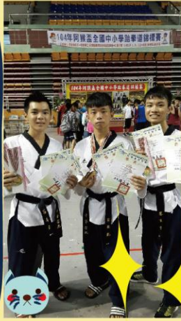
104年阿猴盃全國中小學跆拳道錦標賽