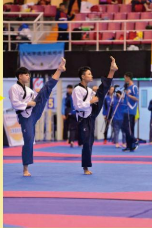
品勢高中男子團體組