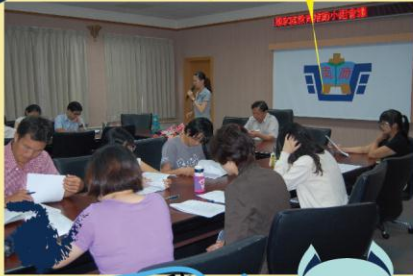
家庭教育推動小組會議