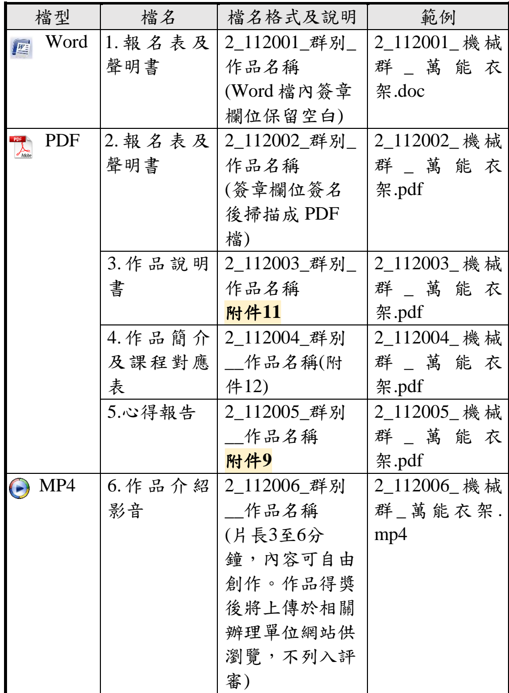
表1-4創意組電子檔檔名範例說明