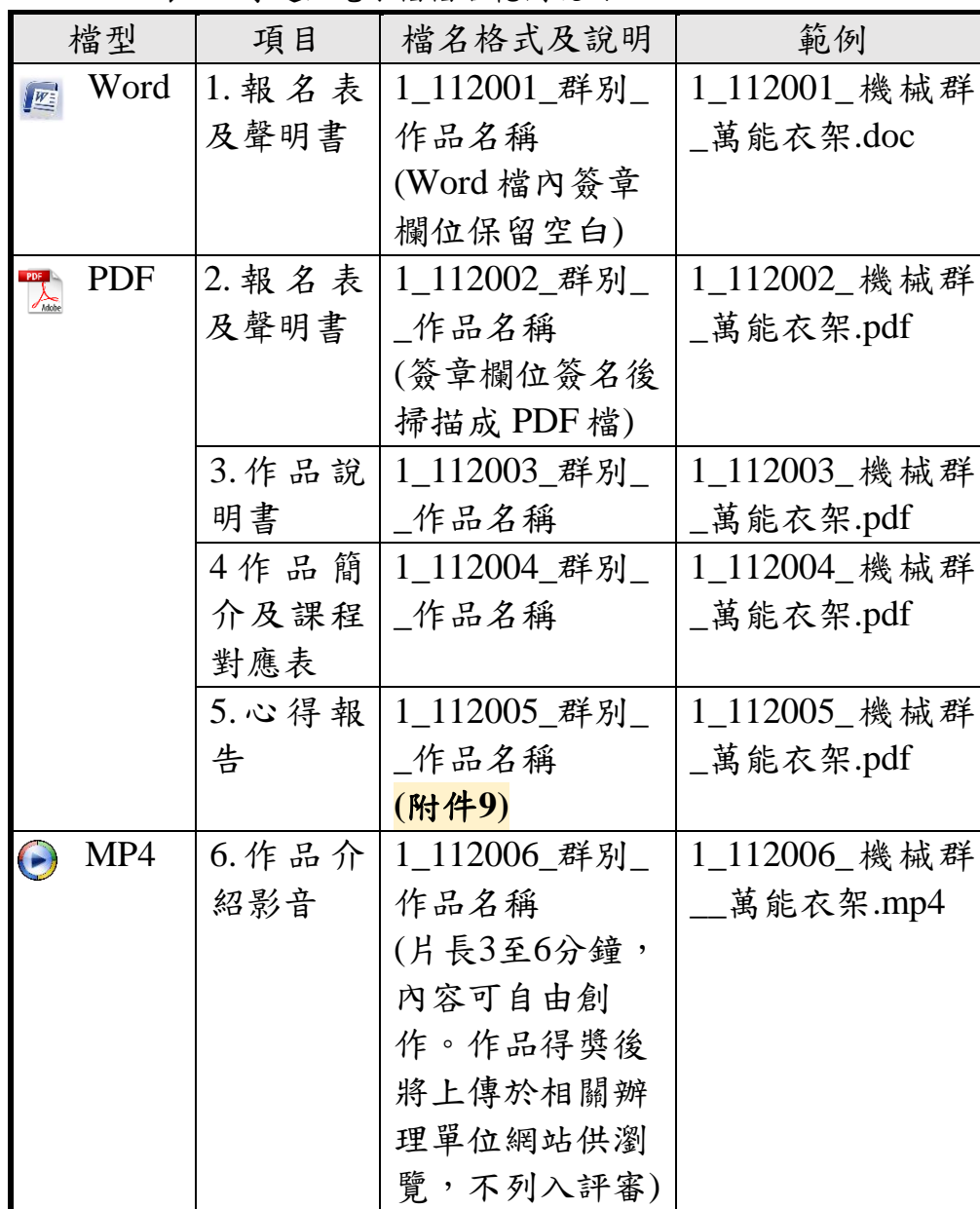
表1-2專題組電子檔檔名範例說明