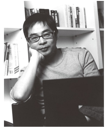
走向世界的繪本作家-幾米

幾米：月亮對我來說一直是溫柔與接納的象徵，我在作品裡面畫過非常多的月亮，看到這麼多年來我表現出來的各種月亮，大都是陪伴孤獨、傾聽心聲的角色。二十多年前生病後，經過完整的住院治療後出院，在家調養時我去學了氣功。練氣功時就是晚上在一個小學的操場上練功，那時候我就會抬頭看著月亮，把我的苦悶對它傾訴。生活裡有太多的事，或苦惱或煩憂，我只能說給月亮聽。因此我一直覺得我欠月亮一本書，很快地就畫了《月亮忘記了》，那是我回報給月亮的感謝。