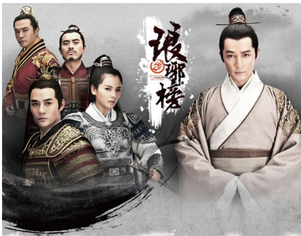
《琅琊榜》書本電視集劇照

六月我即將畢業了，我會記得台南高商帶給我許多美好，運動會的盡力奔跑、校歌比賽的五音不全、迎新活動的唱跳吃喝、導師的諄諄教誨、老師們的用心教導、戶外教學時和同學一起玩樂一起吃飯一起過夜……這些都將在我的心底，伴隨我繼續勇敢面對未來的日子。