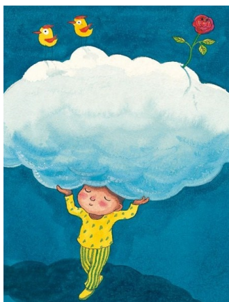
幾米作品《世界別為我擔心》

♥人生很長，別一下子，耗盡熱情與力氣，慢慢走！ ♥持之以恆的祕密就是持之以恆。 ♥月亮只是幾度盈虧，人間卻已多少翻騰。