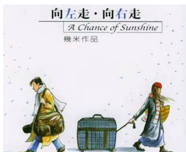
幾米作品《向左走·向右走》