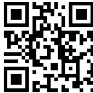
國立雲林科技大學 工業工程與管理系